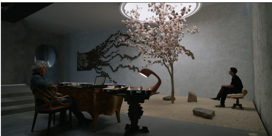
Figuras 7 e 8 – Frames de Entrevista com o Vampiro (AMC), temporada 01, episódio 04.