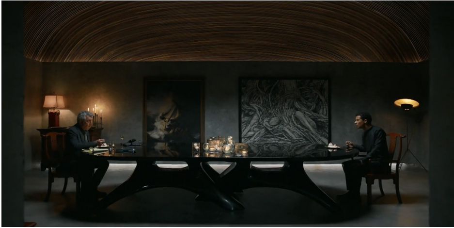
Figura 5 – Frame de Entrevista com o Vampiro (AMC), temporada 01, episódio 02.

O terceiro episódio, “Is My Very Nature That of a Devil”, foi exibido em 16 de outubro de 2022, com roteiro de Jonathan Ceniceroy e direção de Keith Powell. Este episódio, ambientado em 1917, tem a Primeira Guerra Mundial como pano de fundo, destacando o envio de jovens soldados para batalhar na Europa. Este episódio desloca a atenção para a inscrição histórica e social do vampirismo, explorando a relação entre passado e presente através de documentos, lugares e músicas. A praça frequentada por Lestat e Louis, nos arredores da Saint Louis Cathedral de Nova Orleans, torna-se uma espécie de palimpsesto urbano, carregado de memórias e disputas que se cruzam com referências concretas, como a Portaria 4118, evocando os conflitos civis e étnicos que marcaram Nova Orleans.