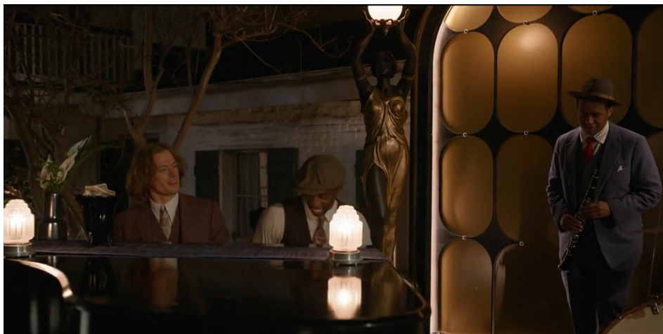
Figura 6 – Frame de Entrevista com o Vampiro (AMC), temporada 01, episódio 03.

“Cinquenta anos depois, você fala como se ele fosse sua alma gêmea, como se estivesse preso em um romance gótico”, provoca Daniel. “Esta é a odisseia da reconstrução”, responde Louis, lendo a frase do livro de memórias de Daniel. “As fitas são uma atuação admitida”, continua o vampiro. “Essa é a premissa da nossa entrevista. Meio século depois, permita-me ter minha própria odisseia [de reconstrução].” (AMC 2022)