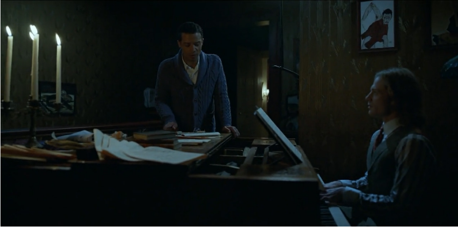
Figura 9 – Frame de Entrevista com o Vampiro (AMC), temporada 01, episódio 05

Quando a jovem vampira, em conflito com seus pais, deixa Nova Orleans em busca de respostas sobre si e sua espécie, o que ela encontra é igualmente solitário e impreciso, além de violento. O livro de etiqueta entregue a Claudia pelo vampiro abusivo Bruce, o único imortal que chega a encontrar, introduz outra materialidade significativa, um objeto pedagógico que, em mãos abusivas, se transforma em instrumento de opressão e controle. Quando Claudia os deixa, Louis se agarra a jornais e livros velhos, amontoando papéis como se pudesse deter o fluxo do tempo ou reconquistar notícias da filha perdida.