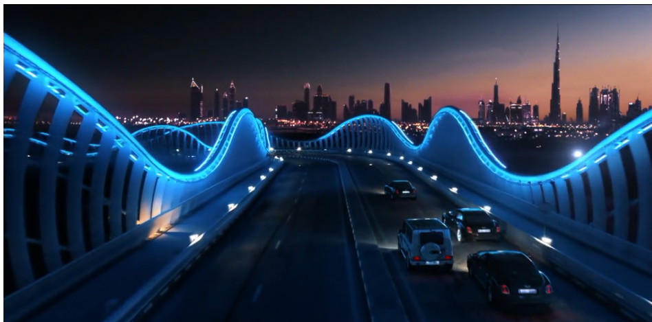
Figuras 1 e 2 – Frames de Entrevista com o Vampiro (AMC), temporada 01, episódio 01.

As fitas chegam acompanhadas de uma carta suntuosa, cuja escrita caligráfica em papel linho cortado à mão corta o tempo da narrativa como uma presença do passado. O conteúdo da carta é transmitido ao espectador com uma narrativa em off. A primeira sequência de Molloy é risível em sua banalidade, numa existência vazia e apática, até ser interrompida pela voz articulada desse interlocutor de outras eras e de uma visão de uma Dubai ultra tecnológica à noite. O modernismo elegante dessa imagem noturna contrasta com o ambiente algo caótico e desorganizada da casa de Molloy nos Estados Unidos.