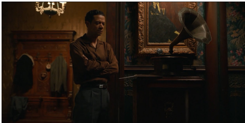
Figura 10 – Frame de Entrevista com o Vampiro (AMC), temporada 01, episódio 06.

Do ponto de vista histórico, a audição de rádio anuncia a eclosão da Segunda Guerra Mundial, por volta de 1939. O rádio, símbolo da comunicação de massa do século XX, insere a narrativa íntima dos vampiros no fluxo da história coletiva, lembrando que nem mesmo a imortalidade pode escapar às convulsões do tempo. Esse recurso desloca o espectador do espaço privado da reconciliação entre Louis e Lestat para a consciência da catástrofe global, sublinhando a contradição entre a eternidade e a aceleração bélica da modernidade.