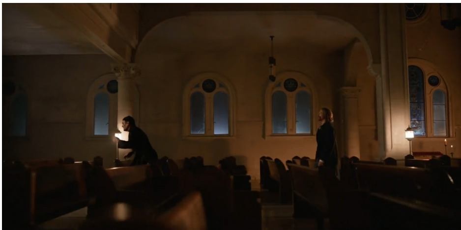
Figuras 3 e 4 – Frames de Entrevista com o Vampiro (AMC), temporada 01, episódio 01.

Aqui, vale uma nota sobre os espaços internos onde se dá a entrevista, espaços amplos e abertos, quase quartos cavernosos mais do que apropriados à fruição do tempo e à lentidão dos rituais de conversa, escuta e fala que veremos serem encenados episódio após episódio. A sala do apartamento de Dubai é o primeiro cenário que veremos na série. Nela, janelas amplas que dão para o dia e a noite, com filtros nos vidros para afastar a luz solar dos moradores vampíricos dá às cenas a intimidade de cômodos escuros e aconchegantes, como se o limite entre sonho, delírio e realidade fosse muito tênue, ou até inexistente.